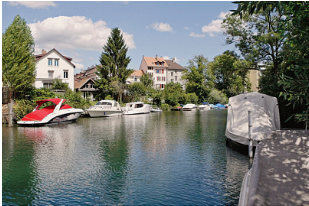
Entre la baie du lac et le château de Nidau, les autorités biennoises et nidowiennes désirent qu'un nouveau quartier voie le jour sur une surface d'environ 163 000 mètres carrés. Mais le projet prend du retard.