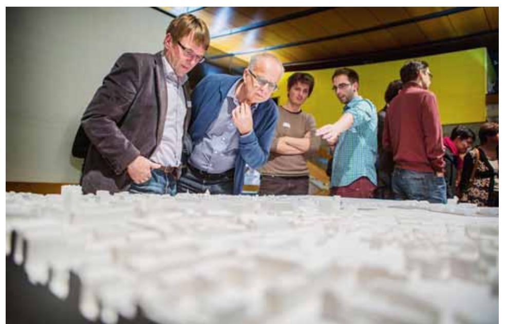
Les avis restent mitigés au terme de la procédure de participation.

L'UDC nidovienne ne partage pas du tout cette opinion. Elle estime que l'absence de places de stationnement et l'interdiction faite aux voitures de circuler dans ce nouveau quartier ne feraient qu'augmenter le trafic dans les rues voisines, où les nouveaux résidents chercheraient inévitablement à se garer. Les organisations environnementales partent au contraire du principe que le parking de la gare de Bienne ne se trouve qu'à quelques pas et qu'Agglolac serait très bien desservi par les transports publics. Elles misent aussi sur l'engouement de la population pour des zones d'habitation sans voitures. Et de militer pour un concept de mobili-