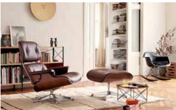
Lounge Chair Design: Charles & Ray Eames, 1956

«Home Stories pour l'hiver»: Achetez un fauteuil Lounge Chair au Grand Repos et profitez! www.vitra.com/winterstories